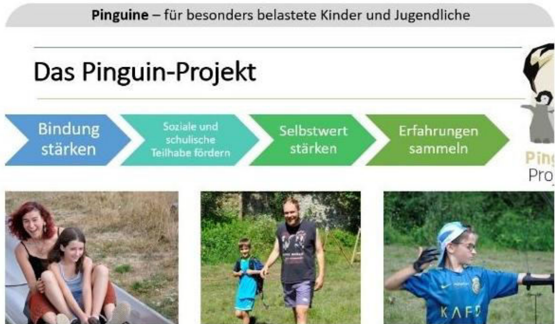
Eine Kooperation der AKTION – Perspektiven e. V. mit der Justus-Liebig-Universität Gießen

den Kindern ein – egal, ob es um Konzentrations-, Lern- oder Sprachförderung, die Stärkung des Selbstvertrauens und Selbstwertgefühls oder um eine erweiterte Bewegungs- und Freizeitgestaltung ging.