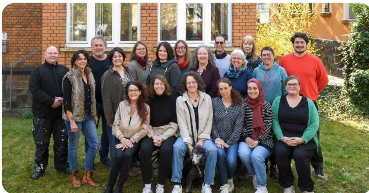
Gesamteam der AKTION – Perspektiven für junge Menschen und Familien e. V. – 2024

Von der Beratung durch niedrigschwellige Gesprächsangebote bis hin zur längerfristigen Begleitung und Betreuung sind dabei in 14 Projekten insgesamt 25 hauptamtliche Fachkräfte tätig. Nach dem Prinzip der Hilfe zur Selbsthilfe ist es dabei unser Ziel, soziale Benachteiligungen abzubauen, die persönliche Entwicklung unserer Klient*innen zu fördern und mit ihnen gemeinsam neue Perspektiven zu erarbeiten.