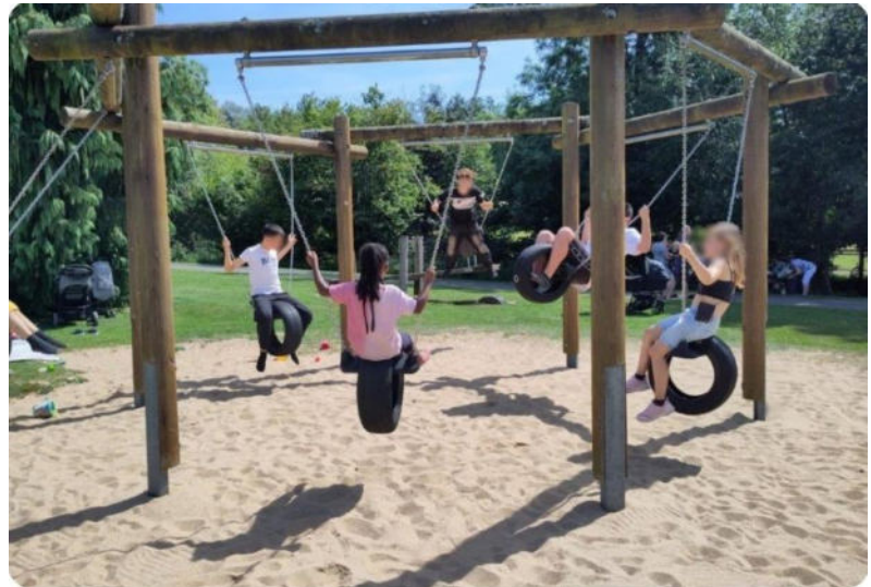
Ausflug der Familien in den Vogelpark Schotten

Außerdem haben wir uns an Aktivitäten im Stadtteil (Nordstadtfest, Spielplatzaktion, Suppenfest, Tannenzauber) sowie dem Fest zum Weltkindertag in der Wieseckau mit einem Spiel- und Bastelangebot beteiligt.