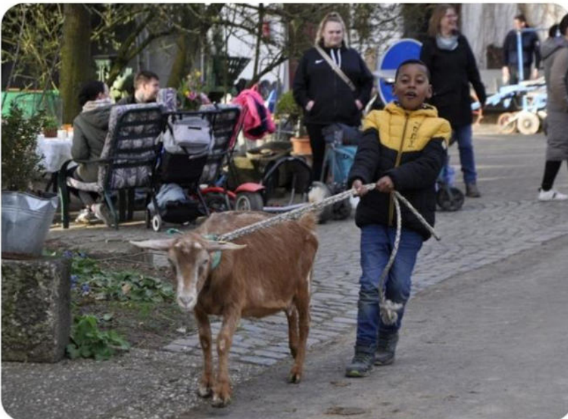
Ausflug der Familien zum Erlebnisbauernhof Diehl

2025 freuen wir uns auf den geplanten Umzug in das Gebäude des Familienzentrums der Paulusgemeinde im Herzen der Gießener Nordstadt. Die neuen, großzügigeren Räumlichkeiten bieten auch bessere Möglichkeiten für Einzelberatungen sowie für eine konzeptionelle Erweiterung der Gruppenangebote.