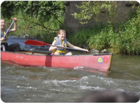
Kanutour mit den Pinguinen

Wie in den vorherigen Durchgängen konnten wir den Kindern beim gemeinsamen Abschlussevent im Sommer auch diesmal wieder eine tolle Erfahrung ermöglichen: Finanziert über eine Projektförderung der Stadt Gießen fand in Kooperation mit einer Pfadfindergruppe eine Kanutour statt – mit den Kindern, den Studierenden und Mitarbeiter*innen der AKTION – Perspektiven e. V. Die Paddeltour startete in Odenhausen an der Lahn und ging flussabwärts bis zu einem schönen Gelände der Pfad-