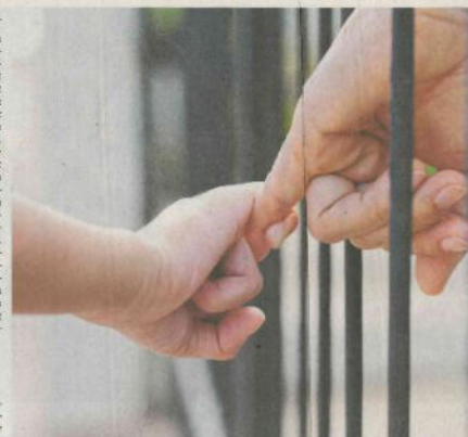
Wenn ein Elternteil ins Gefängnis muss, sind auch die Kinder betroffen.