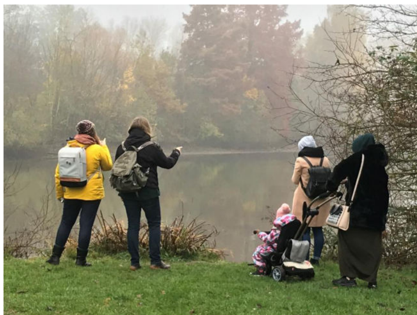
Tandemberatung in der AEH

Auch die Arbeit im Tandem, bei der zwei Mitarbeitende gleichzeitig in einer Familie tätig sind, wird zunehmend nachgefragt. Diese Methode stellt eine wertvolle Bereicherung unserer Arbeit dar, da sie eine intensivere, individuellere Unterstützung für die betroffenen Familien ermöglicht und sich als besonders effektiv erweist, wenn komplexe Problemlagen zu bewältigen sind. Zugleich stellt sie auch eine Herausforderung für uns dar, da sie uns ein hohes Maß an