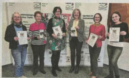
Sie haben alles organisiert.

Infos gibt auch das Frauenbüro des Landkreises Gießen telefonisch unter 0641/9390-1490 oder per E-Mail an angelika.kaeemmler@lkgi.de .