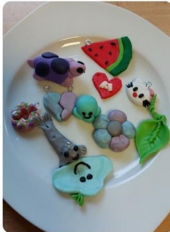
Ergebnisse des alltagsstrukturierenden Projekts in der Frauenwohngruppe

Im Gruppensetting lernten die jungen Frauen handwerkliche und gestalterische Techniken kennen. So bauten wir im vergangenen Jahr gemeinsam neue Möbel auf, bastelten – jahreszeitlich passend – originelle Weihnachtskarten oder kreierten witzige Halloween-Kekse. Gerne dürfen sich die Bewohnerinnen mit ihren Ideen und Wünschen einbringen, wodurch die Möglichkeiten, den eigenen Fähigkeiten auf die Spur zu kommen, auch im vergangenen Jahr wieder enorm erweitert wurden. Einige Frauen konnten ihr Selbstvertrauen stärken, indem sie den anderen Teilnehmerinnen (und auch uns) zum Beispiel das Knüpfen von Armbändern beibrachten oder Gesellschaftsspiele erklärten. Diese Momente zeigen, wie wertvoll das Lernen innerhalb der Gruppe für alle Beteiligten sein kann. Immer wieder entstanden dabei offene und tiefgehende Gespräche – sowohl über persönliche Erlebnisse als auch über politische oder Gesundheitsthemen. Je nach Konstellation konnten die Frauen sehr von den Erfahrungen der anderen profitieren. Und es war schön zu sehen, dass es mitunter wenig Lenkung brauchte, um ihr Vertrauen in die eigene Selbstwirksamkeit zu stärken.