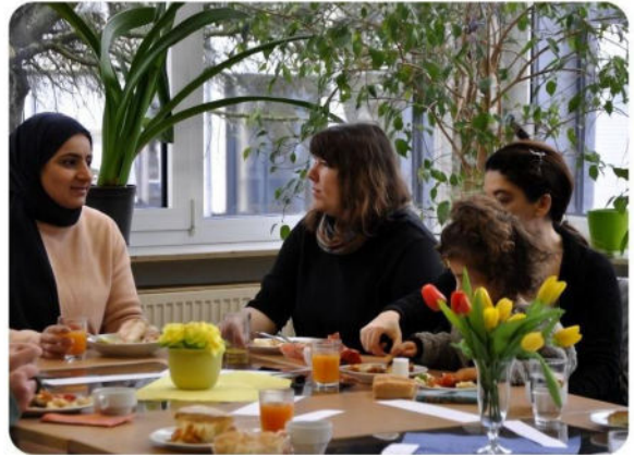
Das Müttercafé in der Kontakt- und Beratungsstelle Aktino

Ein besonderes Merkmal des Müttercafés: Wir stellen einen Grundstock an Lebensmitteln wie Kaffee, Saft, Brötchen, Wurst oder Käse bereit – und alles Weitere organisieren die Frauen selbst. Oft bringen sie eigens zubereitete kulinarische Köstlichkeiten aus ihren Herkunftsländern mit, was das Müttercafé zu einem Ort des kulturellen Austauschs macht. Es ist beeindruckend zu sehen, wie hier Vielfalt gelebt wird und eine gemeinsame Mahlzeit Menschen verbindet.