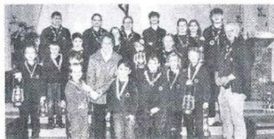
Die Pfadfinder vom Stamm »Wikinger« bringen das Friedenslicht zu den Menschen nach Beuern.